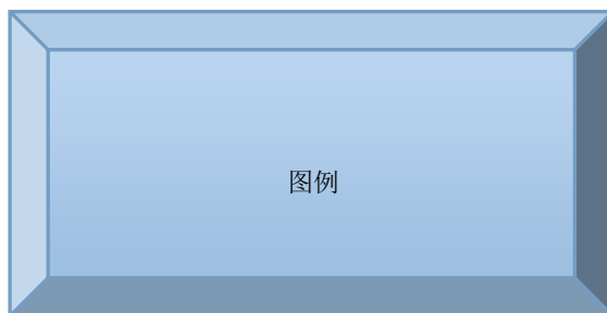
图1. 图名(小五宋体, 下空0.5行)

注: 图表中说明文字采用小五号宋体, 英文采用 Times New Roman 字体, 物理量和计量单位必须符合国家标准和国际标准。